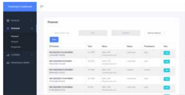
Gambar 16 Halaman Pesanan