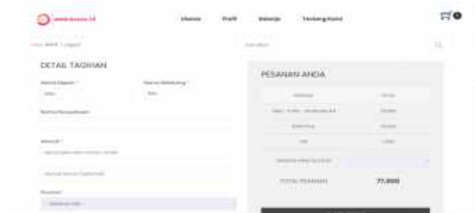
Gambar 11 Halaman Form Tagihan

Halaman Midtrans merupakan halaman yang menampilkan proses pembayaran dari Midtrans. Halaman Midtrans dapat dilihat pada gambar 12 berikut.