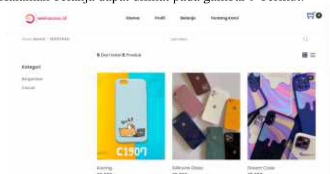
Gambar 9 Halaman Belanja

Halaman belanja merupakan halaman yang menampilkan semua produk yang ada pada database website. Halaman belanja dapat dilihat pada gambar 9 berikut.