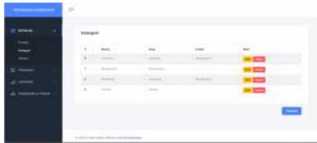
Gambar 15 Halaman Kategori