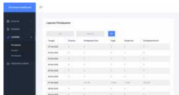
Gambar 17 Halaman Laporan