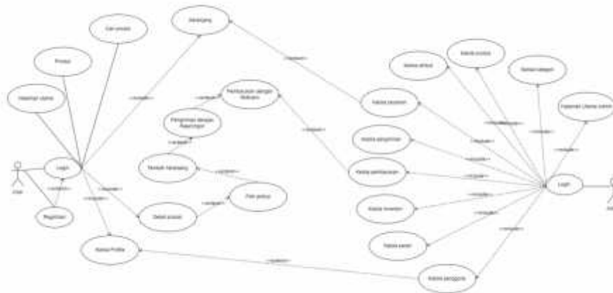
Gambar 1 Usecase Diagram Website Emiracase

Usecase diagram pada penelitian ini menggambarkan interaksi antara aktor dan sistem yang akan dibangun. Aktor pada penelitian ini ada dua yaitu admin dan pengguna. Kedua aktor tersebut memiliki fungsi yang berbeda sesuai dengan peran aktor. Usecase diagram dari sistem yang akan dibangun dapat dilihat pada gambar 1 dibawah ini.