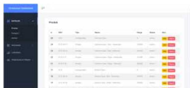
Gambar 14 Halaman Produk