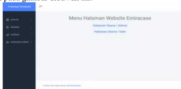
Gambar 13 Halaman Utama Admin

Halaman untuk admin berisi halaman utama, produk, kategori, atribut, pesanan, laporan, pengguna dan peran. Halaman-halaman ini akan berfungsi sebagai ruang kedali admin dalam mengelola dan mengolah data sistem yang ada di database. Tampilan masing-masing halaman dapat dilihat pada gambar dibawah ini.