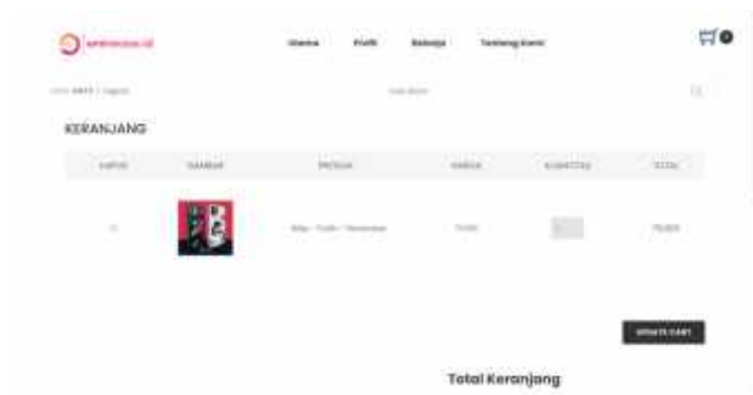
Gambar 10 Halaman Keranjang

Halaman keranjang merupakan halaman yang menampilkan produk yang telah ditambahkan oleh pengguna kedalam keranjang. Halaman keranjang dapat dilihat pada gambar 10 berikut.