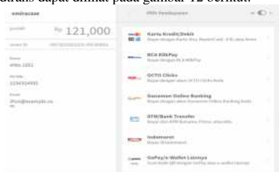
Gambar 12 Halaman Midtrans

Halaman Midtrans merupakan halaman yang menampilkan proses pembayaran dari Midtrans. Halaman Midtrans dapat dilihat pada gambar 12 berikut.