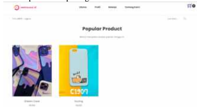
Gambar 8 Halaman Utama

Halaman utama pengguna merupakan tampilan awal saat pengguna mengunjungi website. Pada halaman ini ditampilkan produk populer setiap minggu dan beberapa informasi lainnya. Halaman utama dapat dilihat pada gambar 8 berikut.